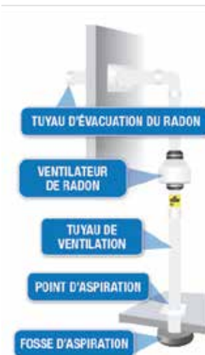
système d'atténuation du radon

Un système d'atténuation du radon est installé avec un ventilateur qui aspire l'air (et le radon) sous la fondation et les évacue vers l'extérieur. Ce système atténue les concentrations de radon en empêchant le radon de pénétrer dans votre maison.