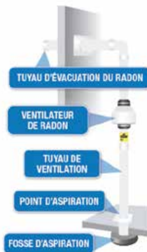
système d'atténuation du radon

C'est en installant un système d'atténuation du radon que l'on atténue le plus les concentrations. Les recherches montrent que les professionnels certifiés en radon peuvent atténuer les concentrations de plus de 90%. D'autres mesures, telles que l'augmentation de la ventilation et le colmatage des fissures, peuvent aider à court